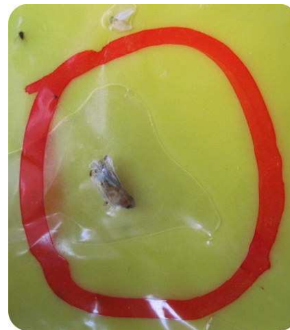
Adulto di scafoideo su trappola cromotattica